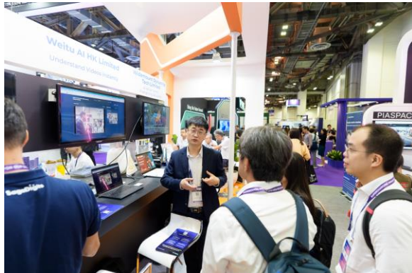
圖五：園區公司 Weitu AI 於上年參與由 Hatch (新加坡內政科技局設立的創新中心) 主辦的首屆 In-Beta 科技驗證計劃，入選並獲得三萬新加坡元獎金、概念驗證及演示機會。