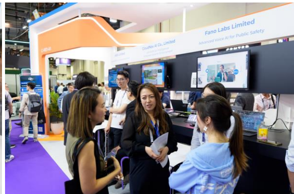
圖六及七：科技園公司在 MTX 2026 展示 10 間園區公司的突破性公共安全科技方案，涵蓋人工智能驅動與機械人技術、網絡與通訊基礎設施，以及無人機、無人駕駛飛行器與低空經濟。