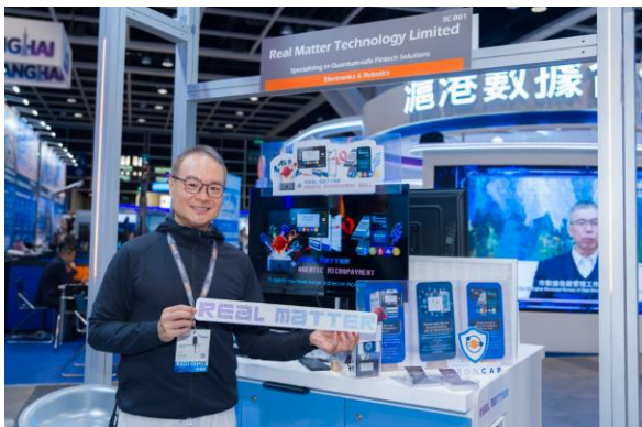
圖六：後量子密碼學及晶片級區塊鏈技術 鞏固數碼安全防線 — 由仲原宇科技（Real Matter Technology Ltd.）研發的後量子密碼學（PQC）及晶片級區塊鏈方案，可為物聯網設備及數碼基礎設施提供足以抵禦量子運算威脅的新世代加密保護，廣泛適用於金融、供應鏈及智慧城市等關鍵領域。