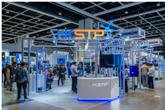
圖二：香港科技園公司率領 16 間本地創科公司於香港科技園公司展館參展，重點展示涵蓋人工智能、數碼轉型、電子及機械人及生命健康科技四大創科領域的多元化創新方案及應用場景。