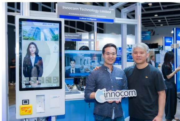
圖四：AI 數碼人及智能客服方案 革新企業服務體驗 — 由鏡軒科技 (Innocorn Technology Ltd.) 研發的一站式 AI 智能服務平台，整合數碼人、AI 聊天機械人、語音客服及實體服務機械人，為企業提供全渠道智能互動體驗，有效提升服務效率並降低運營成本。