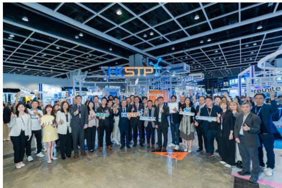
圖一：創新科技及工業局局長孫東教授，參觀香港科技園公司設於「香港國際創科展 2026」（InnoEX）的香港科技園公司展館。