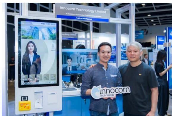
图四：AI 数码人及智能客服方案 革新企业服务体验 — 由镜轩科技 (Innocorn Technology Ltd.) 研发的一站式 AI 智能服务平台，整合数码人、AI 聊天机械人、语音客服及实体服务机械人，为企业提供全渠道智能互动体验，有效提升服务效率并降低运营成本。