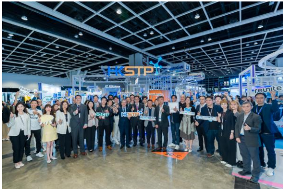
图一：创新科技及工业局局长孙东教授，参观香港科技园公司设于「香港国际创科展 2026」（InnoEX）的香港科技园公司展馆。