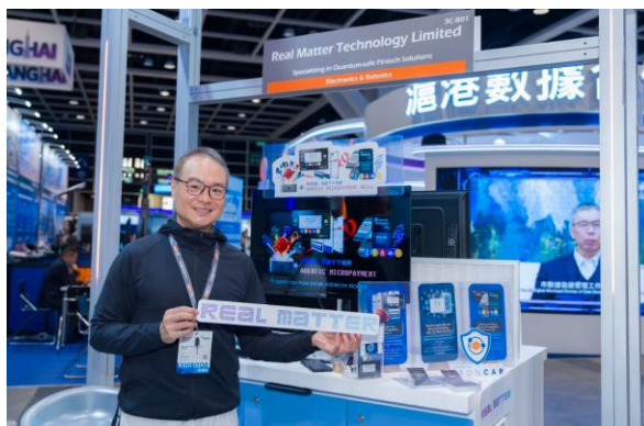
图六：后量子密码学及芯片级区块链技术 巩固数码安全防线 — 由仲原宇科技（Real Matter Technology Ltd.）研发的后量子密码学（PQC）及芯片级区块链方案，可为物联网设备及数码基础设施提供足以抵御量子运算威胁的新世代加密保护，广泛适用于金融、供应链及智慧城市等关键领域。