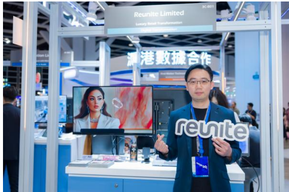
图七：3D沉浸式电商体验 加速零售数码转型 — 由 Reunite Ltd. 研发的数码转型方案，整合 3D 可视化、沉浸式电商及自动化内容生产技术，让消费者透过高度互动的接口浏览及选购商品，同时助企业大幅提升创意内容制作效率，加速品牌数码化转型进程。