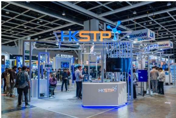
图二：香港科技园公司率领 16 间本地创科公司于香港科技园公司展馆参展，重点展示涵盖人工智能、数码转型、电子及机械人及生命健康科技四大创科领域的多元化创新方案及应用场景。