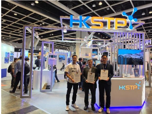
图九：科技园公司园区企业于第十一届香港科技创价大赛中表现卓越，中国北斗空天信息有限公司、Reunite Ltd. 以及 Scan the World Limited 夺得优异奖。