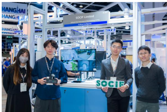
图八：运用已有镜头, 提供AI 影像分析系统 - 优化人流与车流管理 — 由 SOCIF Ltd. 研发的 AI 视频分析系统，可对人流及车流进行实时智能监测、追踪与数据分析，广泛应用于城市交通管理、商业空间运营及公共安全等场景，助政府机构及企业实现数据驱动的智能管理决策。