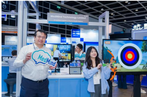
图五：AI互动方案涵盖医疗、教育及企业服务－医念科技（MedMind Technology）的 NeuroGym 及 PhysioPlay 平台，透过麻将、书法等本地化游戏及体感互动技术进行认知与体能训练，并配备自动化数据分析，实时生成个人化报告。方案另涵盖 AI 语音关怀及智能化身系统，适用于医院、复康中心、居家护理、教育，以及推广活动、顾客互动、员工全人健康计划、企业社会责任及 ESG 等企业应用场景。