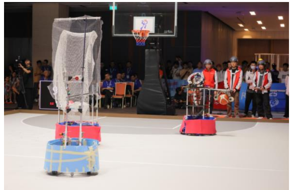
圖二至六：「全港大專生機械人大賽 2025」吸引逾 200 名來自八間大專院校的學生，以自主設計的機械「籃球員」上場競技，展示傳球及投籃等高難度動作。