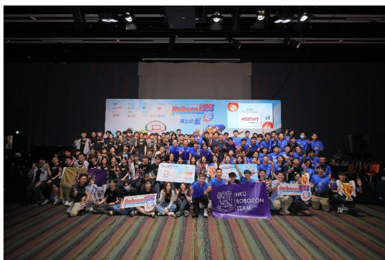
圖一：香港科技園公司舉辦年度「全港大專生機械人大賽 2025」，冠軍、亞軍及季軍分別由香港大學的「明德」、香港中文大學的「迎籃而上」、香港大學的「格物」奪得。數字政策專員黃志光先生向優勝隊伍頒發獎項。