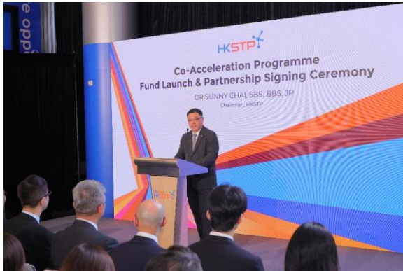
圖三：香港科技園公司主席查毅超博士指出，為「香港科技園共同企業加速計劃」成立的基金將推動香港最具潛力的創新者登上國際舞台，帶動關鍵產業的突破，並鞏固香港作為國際領先創科中心的地位。