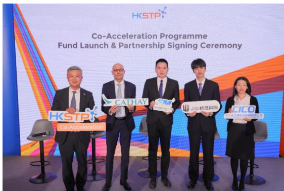
圖四：為「香港科技園共同企業加速計劃」成立的基金的策略合作夥伴的講者就香港為何及如何成為新一代初創推動者分享其見解。(由左起)