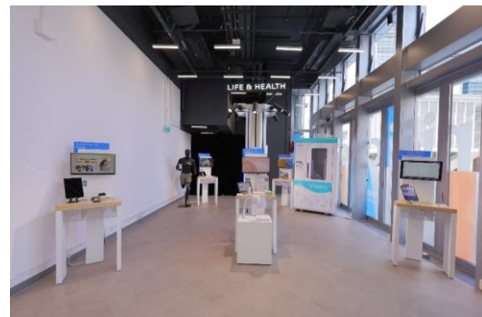
圖六至圖九：ARENA 為初創科企業提供一個高曝光的拔尖平台，為 23 間精選的企業，提供與科技園公司生態圈內過千名投資者和企業直接聯繫。