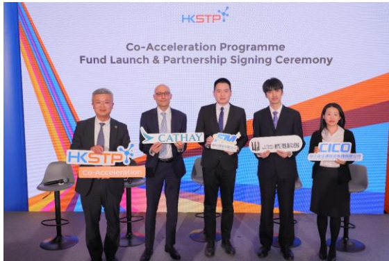
图四：为「香港科技园共同企业加速计划」成立的基金的战略合作伙伴的讲者就香港为何及如何成为新一代初创推动者分享其见解。（由左起）