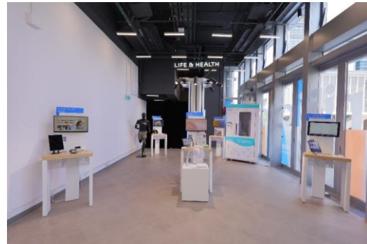
图六至图九：ARENA 为初创科技企业提供一个高曝光的拔尖平台，为 23 间精选的企业，提供与科技园公司生态圈内过千名投资者和企业直接联系。