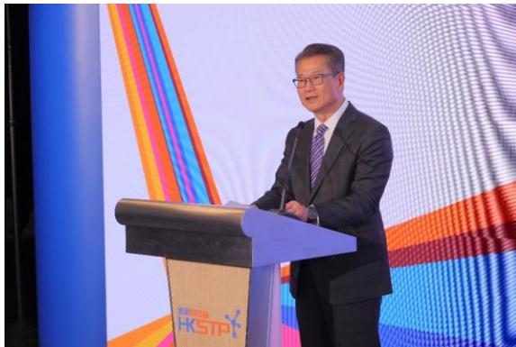
图二：香港特别行政区政府财政司司长陈茂波先生主持了启动仪式。