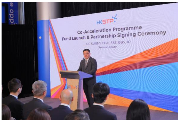
图三：香港科技园公司主席查毅超博士指出，为「香港科技园共同企业加速计划」成立的基金将推动香港最具潜力的创新者登上国际舞台，带动关键产业的突破，并巩固香港作为国际领先创科中心的地位。