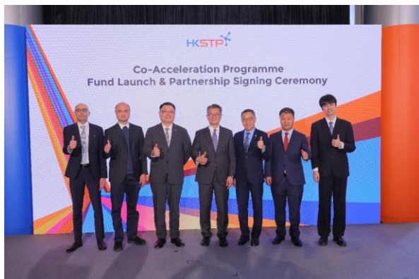
图一： 科技园公司今日正式启动为「香港科技园共同企业加速计划」成立的基金，并同时公布首批四间策略伙伴企业。该基金是香港首个在创科领域的公私营协作（PPP），并由香港政府持有及作为科技园公司旗下已取得证监会牌照的附属公司担任该香港有限合伙基金（HKLPF）的投资经理，管理该基金。（由左起）